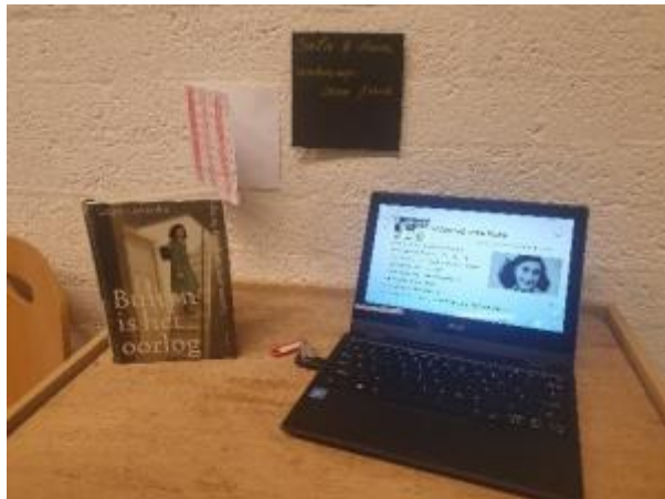
1 - Werkstukken tentoonstelling in 't Uilennest